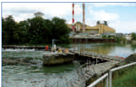
Barrage Vauxrot - Communes de Cuffies et Soissons

Enfin, une coordination continue sera toujours nécessaire puisque VNF reste gestionnaire des autres ouvrages de l'Aisne et de la Meuse, comme les écluses et les biefs, et reste aussi garant des services rendus par la voie d'eau, pour la navigation et pour les autres usages de l'eau (alimentation en eau potable, eau industrielle, ...) pour lesquels nous devons évidemment assurer une étroite liaison avec BAMEO.