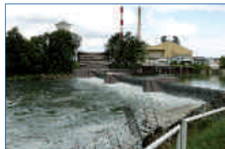
Photomontage barrage Vauxrot équipé de bouchures gonflables à l'eau

Retrouvez toute l'actualité : www.bameo.fr