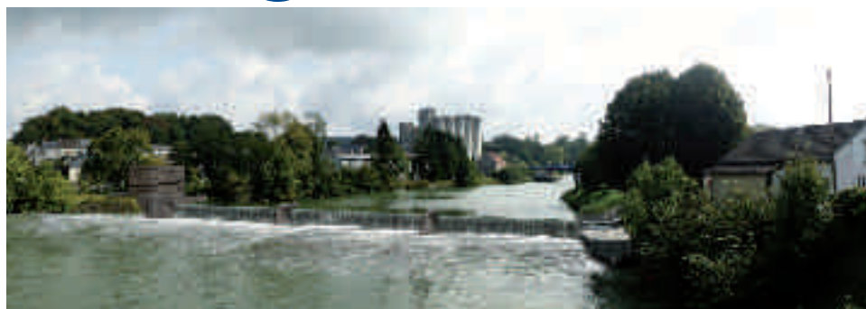
Photomontage du barrage de Vic-sur-Aisne

Les barrages à aiguilles présents sur l'Aisne ont été construits au 19 ème siècle suite à l'invention d'Antoine POIREE, né à Soissons. Révolutionnaires lors de leur installation, ils ont permis à l'époque de développer la navigation sur la rivière, notamment lors des périodes d'étiage, en saison estivale, lorsque le niveau de l'eau est au plus bas. Cependant, ce système de rideaux d'aiguilles mis verticalement côte à côte barrant ainsi le lit de la rivière nécessite un travail long, fastidieux et dangereux lors des manœuvres. A titre d'exemple, il faut compter environ 36 heures de travail de