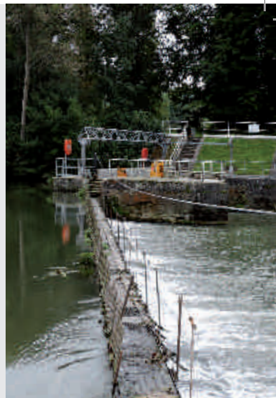
Barrage du Héran